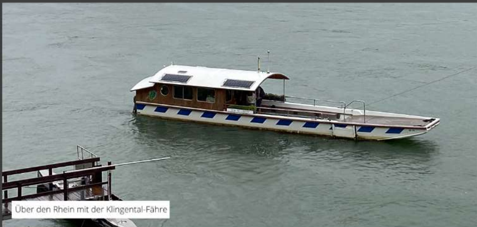
Über den Rhein mit der Klingental-Fähre