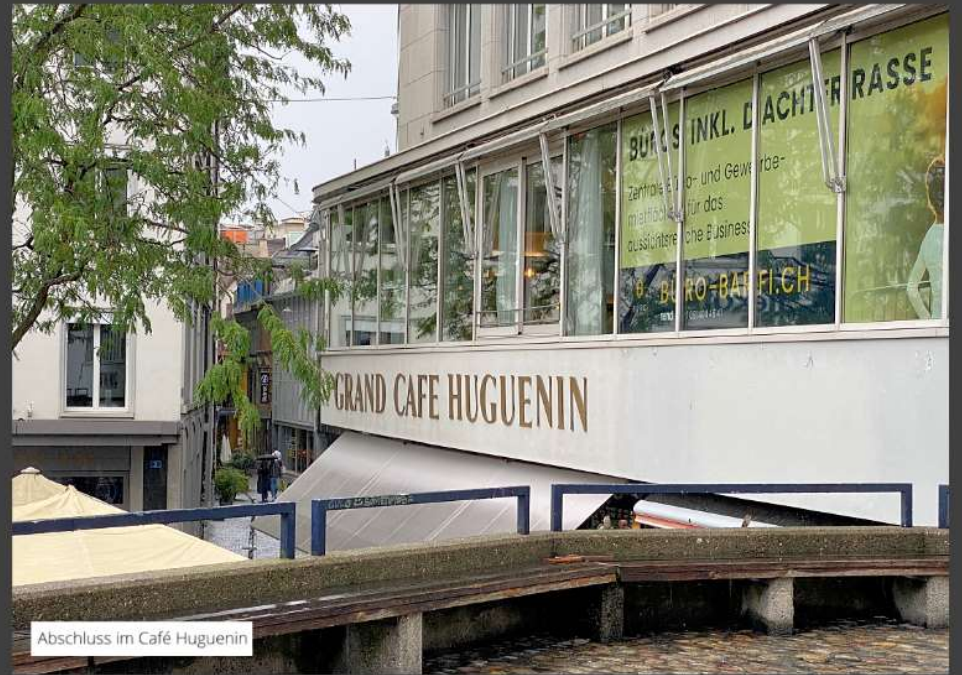
Abschluss im Café Huguenin