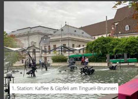
1. Station: Kaffee & Gipfeli am Tingueli-Brunnen