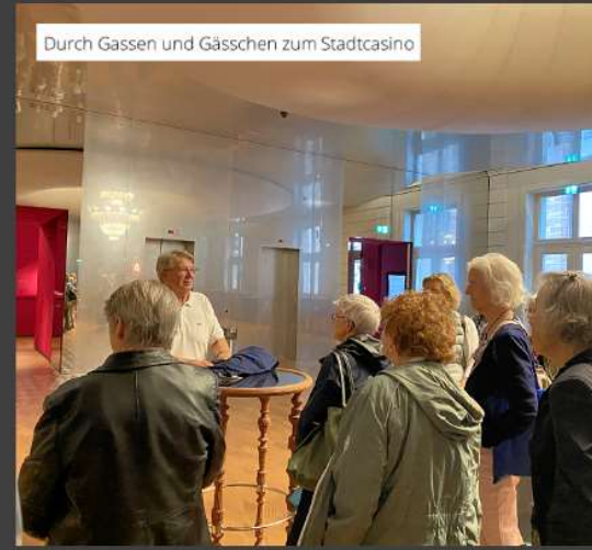
Durch Gassen und Gässchen zum Stadtcasino